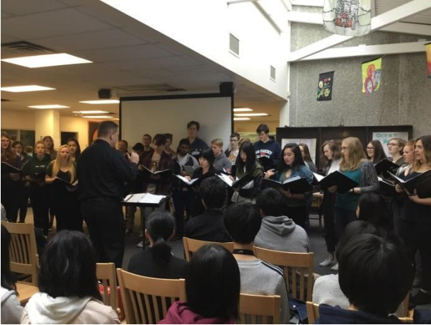
北高生によるプレゼン