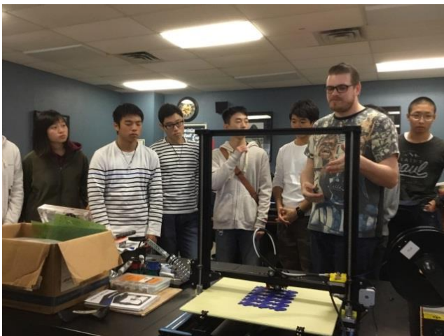
ディスカッションの様子