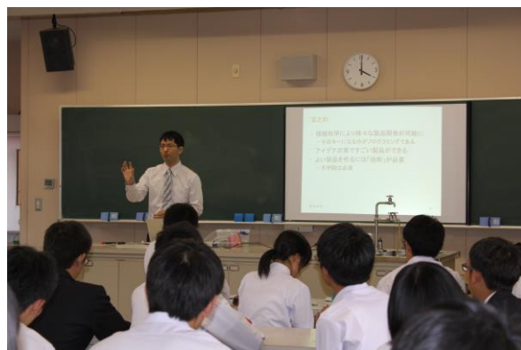
熱心に話を聞く生徒