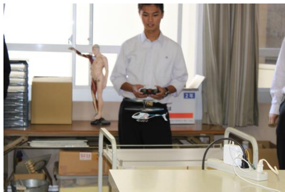
ラジコンヘリを実際に操作