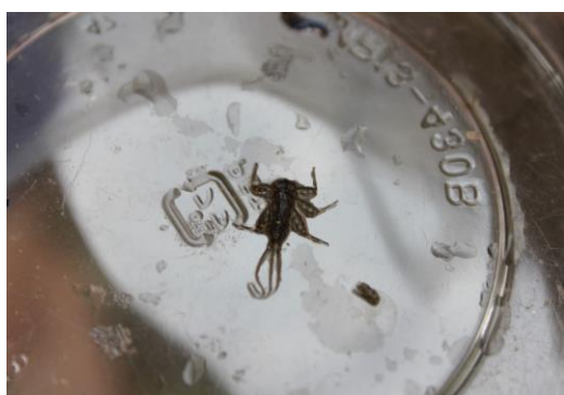
採取した水生昆虫