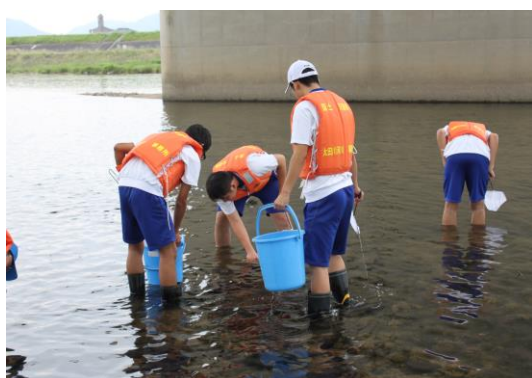
3 グループで水生生物の採取

調査結果：安佐大橋付近の左岸で調査しましたが、四段階ある水質階級の中で、2 番目にきれいな「ややきれいな水」という結果になりました。