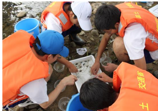
採取した生物を分類する生徒