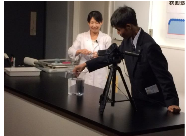
姫路科学館にて表面張力の実験を行いました。