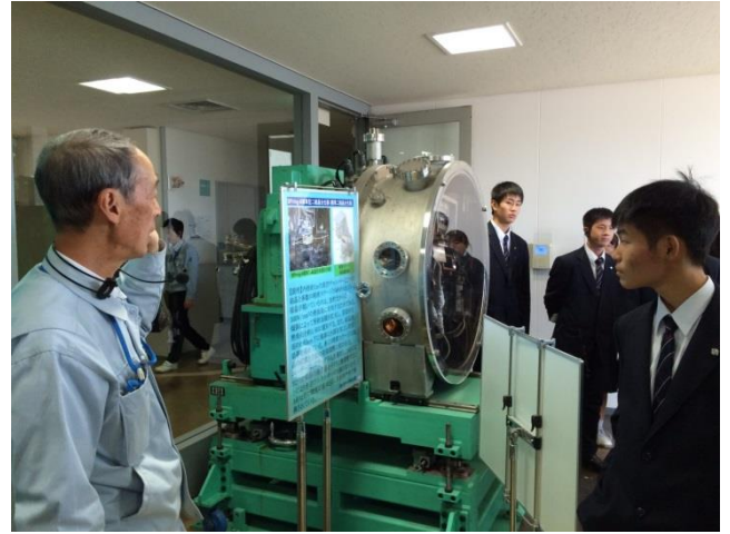
SPring-8にて世界一の顕微鏡を見学しました。

SPring-8 (スプリングエイト、Super Photon ring-8 GeV) は、兵庫県佐用郡佐用町光都一丁目1番1号、播磨科学公園都市内に位置する大型放射光施設。電子を加速・貯蔵するための加速器群と発生した放射光を利用するための実験施設および各種付属施設から成る。名前の8は電子の最大加速エネルギーである8GeVに因んでつけられた。(Wikipediaより引用)