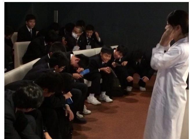
楽しい講義をありがとうございました。