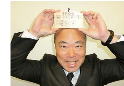
北野天満宮に奉納された絵馬